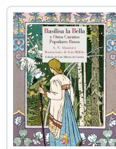
BASILISA LA BELLA Y OTROS CUENTOS POPULARES RUSOS AFANÁSIEV, ALEKSANDR NIKOLÁYEVICH