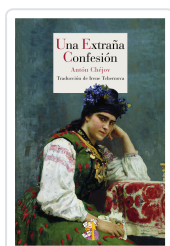
UNA EXTRAÑA CONFESIÓN CHÉJOV, ANTÓN