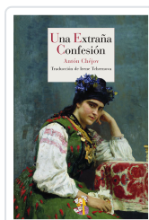
UNA EXTRAÑA CONFESIÓN CHÉJOV, ANTÓN