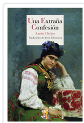
UNA EXTRAÑA CONFESIÓN CHÉJOV, ANTÓN