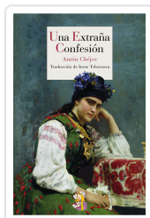
UNA EXTRAÑA CONFESIÓN CHÉJOV, ANTÓN