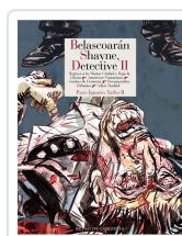
BELASCOARÁN SHAYNE, DETECTIVE II TAIBO II, PACO IGNACIO