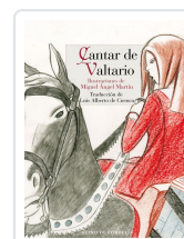
CANTAR DE VALTARIO ANÓNIMO