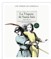
LA VÍSPERA DE SANTA INÉS KEATS, JOHN