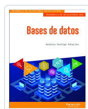
BASES DE DATOS POSTIGO PALACIOS, ANTONIO