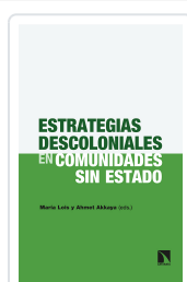
ESTRATEGIAS DESCOLONIALES EN COMUNIDADES SIN ESTADO LOIS, MARÍA / AKKAYA, AHMET