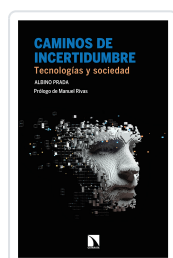
CAMINOS DE INCERTIDUMBRE PRADA, ALBINO