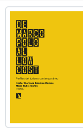
DE MARCO POLO AL LOW COST MARTÍNEZ SÁNCHEZ- MATEOS, HÉCTOR/RUBIO MARTÍN, MARÍA