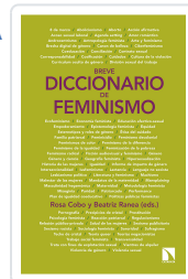
BREVE DICCIONARIO DE FEMINISMO COBO BEDIA, ROSA / RANEA TRIVIÑO, BEATRIZ