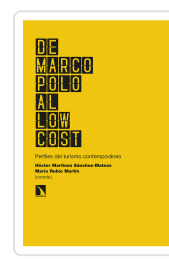
DE MARCO POLO AL LOW COST MARTÍNEZ SÁNCHEZ-MATEOS, HÉCTOR/RUBIO MARTÍN, MARÍA