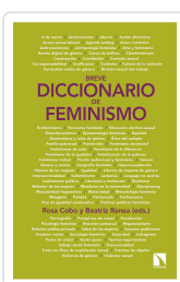
BREVE DICCIONARIO DE FEMINISMO COBO BEDIA, ROSA / RANEA TRIVIÑO, BEATRIZ