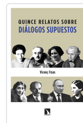
QUINCE RELATOS SOBRE DIÁLOGOS SUPUESTOS FISAS ARMENGOL, VICENÇ