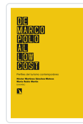
DE MARCO POLO AL LOW COST MARTÍNEZ SÁNCHEZ- MATEOS, HÉCTOR/RUBIO MARTÍN, MARÍA