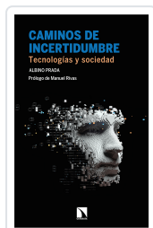
CAMINOS DE INCERTIDUMBRE PRADA, ALBINO