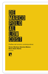
DE MARCO POLO AL LOW COST MARTÍNEZ SÁNCHEZ-MATEOS, HÉCTOR/RUBIO MARTÍN, MARÍA