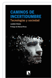
CAMINOS DE INCERTIDUMBRE PRADA, ALBINO