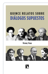
QUINCE RELATOS SOBRE DIÁLOGOS SUPUESTOS FISAS ARMENGOL, VICENÇ