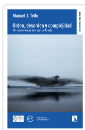
ORDEN, DESORDEN Y COMPLEJIDAD J. TELLO, MANUEL