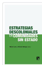
ESTRATEGIAS DESCOLONIALES EN COMUNIDADES SIN ESTADO LOIS, MARÍA / AKKAYA, AHMET