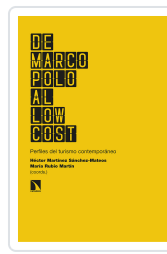
DE MARCO POLO AL LOW COST MARTÍNEZ SÁNCHEZ- MATEOS, HÉCTOR/RUBIO MARTÍN, MARÍA