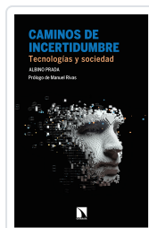
CAMINOS DE INCERTIDUMBRE PRADA, ALBINO