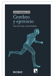
CEREBRO Y EJERCICIO TREJO, JOSÉ LUIS / SANFELIU, CORAL