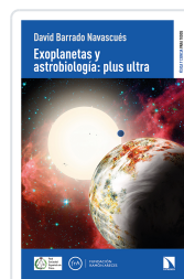
EXOPLANETAS Y ASTROBIOLOGÍA: PLUS ULTRA BARRADO NAVASCUÉS DAVID