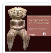
LA REPRODUCCIÓN EN LA PREHISTORIA VILA MITJÀ, ASSUMPCIÓ / ESTÉVEZ ESCALERA, JORDI / LUGLI, FRANCESCA / GRAU REBOL