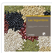
LAS LEGUMBRES CLEMENTE GIMENO, ALFONSO / DE RON PEDREIRA, ANTONIO M.