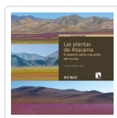
LAS PLANTAS DE ATACAMA PEDRÓS-ALIÓ, CARLOS