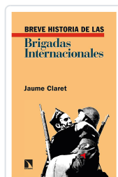
BREVE HISTORIA DE LAS BRIGADAS INTERNACIONALES CLARET, JAUME