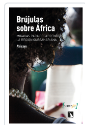
BRÚJULAS SOBRE ÁFRICA AFRICAYE