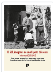
EL SUT. IMÁGENES DE UNA ESPAÑA DIFERENTE GONZÁLEZ DE AGUILAR, ÁLVARO