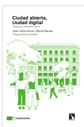
CIUDAD ABIERTA, CIUDAD DIGITAL CARLOS ARNAL, JOSÉ / SARASA, DANIEL