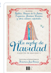
LA NOCHE DE NAVIDAD. CUENTOS DE NAVIDAD II GÓMEZ FERNÁNDEZ, FRANCISCO JOSÉ