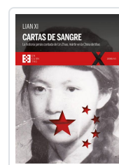
LIAN XI CARTAS DE SANGRE XI, LIAN