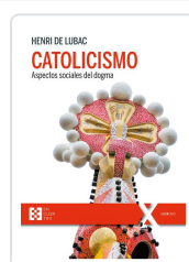
CATOLICISMO HENRI DE LUBAC