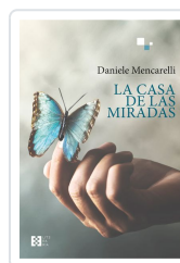
LA CASA DE LAS MIRADAS DANIELE MENCARELLI