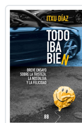
TODO IBA BIEN DÍAZ, ITXU