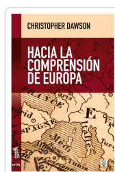
HACIA LA COMPRENSIÓN DE EUROPA DAWSON, CHRISTOPHER