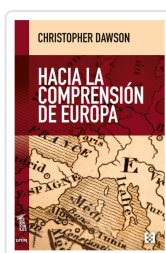
HACIA LA COMPRENSIÓN DE EUROPA DAWSON, CHRISTOPHER