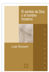
EL SENTIDO DE DIOS Y EL HOMBRE MODERNO GIUSSANI, LUIGI