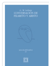
CONVERSACIÓN DE FILARETO Y ARISTO G.W. LEIBNIZ