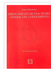
BREVE ESBOZO DE UNA TEORÍA GENERAL DEL CONOCIMIENTO FRANZ BRENTANO