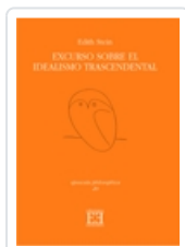
EXCURSUS SOBRE EL IDEALISMO TRASCENDENTAL EDITH STEIN