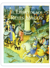
EL LIBRO DE LOS REYES MAGOS JUAN DE HILDESHEIM