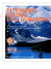
PATRIMONIO NATURAL DE LA HUMANIDAD CLAES GRUNDSTEN, PETER HANNEBERG