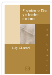
EL SENTIDO DE DIOS Y EL HOMBRE MODERNO GIUSSANI, LUIGI