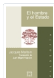
EL HOMBRE Y EL ESTADO JACQUES MARITAIN