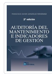
AUDITORÍA DEL MANTENIMIENTO E INDICADORES DE GESTIÓN. 2ª ED. FRANCISCO JAVIER GONZÁLEZ FERNÁNDEZ