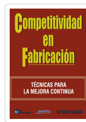
COMPETITIVIDAD EN FABRICACIÓN KIYOSHI SUZAKI