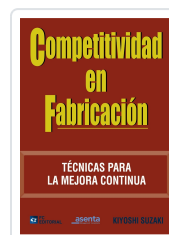
COMPETITIVIDAD EN FABRICACIÓN KIYOSHI SUZAKI