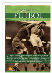
BREVE HISTORIA DEL FÚTBOL UYÁ ESTEBAN, MARCOS