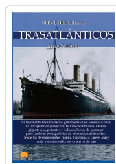
BREVE HISTORIA DE LOS TRASATLÁNTICOS SAN JUAN SÁNCHEZ, VÍCTOR