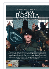
BREVE HISTORIA DE LA GUERRA DE BOSNIA SÁNCHEZ ARANAZ, FERNANDO