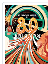
LA VUELTA AL MUNDO EN 80 ENIGMAS FRABETTI, CARLO