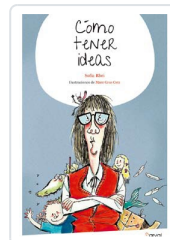
CÓMO TENER IDEAS RHEI, SOFÍA