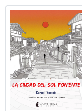
LA CIUDAD DEL SOL PONIENTE YUMOTO, KAZUMI