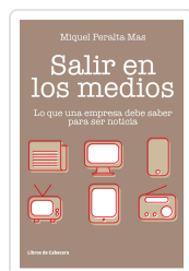
SALIR EN LOS MEDIOS PERALTA MAS, MIGUEL