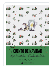
CUENTO DE NAVIDAD DICKENS, CHARLES