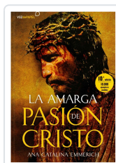
LA AMARGA PASION DE CRISTO (14ªED.) ANA CATALINA EMMERICH