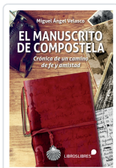
EL MANUSCRITO DE COMPOSTELA MIGUEL ANGEL VELASCO