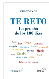
TE RETO. LA PRUEBA DE LOS 100 DIAS AA.VV