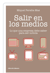
SALIR EN LOS MEDIOS PERALTA MAS, MIQUEL