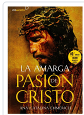
LA AMARGA PASION DE CRISTO (14ªED.) ANA CATALINA EMMERICH