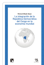
LA ECONOMÍA DE LA REPÚBLICA DEMOCRÁTICA DEL CONGO BILADI ABASI, RICHARD