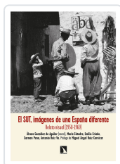
EL SUT, IMÁGENES DE UNA ESPAÑA DIFERENTE GONZÁLEZ DE AGUILAR, ÁLVARO