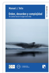
ORDEN, DESORDEN Y COMPLEJIDAD J. TELLO, MANUEL