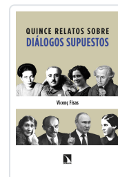
QUINCE RELATOS SOBRE DIÁLOGOS SUPUESTOS FISAS ARMENGOL, VICENÇ