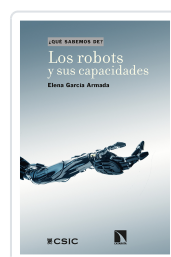
LOS ROBOTS Y SUS CAPACIDADES GARCÍA ARMADA, ELENA