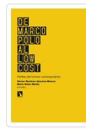
DE MARCO POLO AL LOW COST MARTÍNEZ SÁNCHEZ- MATEOS, HÉCTOR/RUBIO MARTÍN, MARÍA